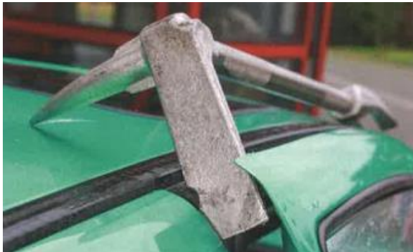
Mit der Querschneide: Schaffen eines Spalts an der Tür