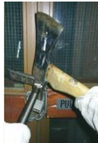
Gewaltsamer Zutritt: Setzen Sie die Querschneide etwa 10-15 cm über oder unter das Schloss zwischen Tür und Zarge. Treiben Sie sie mit einer Axt in die Zarge, durch eine Drehbewegung nach unten wird die Tür aufgehebelt. Je nach Anwendung kann die Axt auch als Hebelauflage oder als Keil genutzt werden. Vorhängeschlösser können durch Einschlagen des Dorns geöffnet werden.