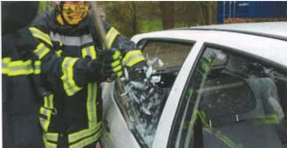
Zeitsparend: Entfernung der Seitenscheibe