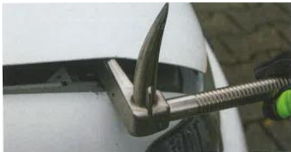
An der Motorhaube: Aufhebeln für den Spreizereinsatz