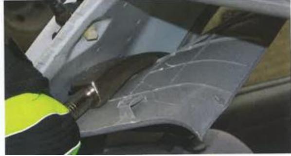
Gefahrenstellen finden: Entfernung von Verkleidungsteilen Im Innenraum