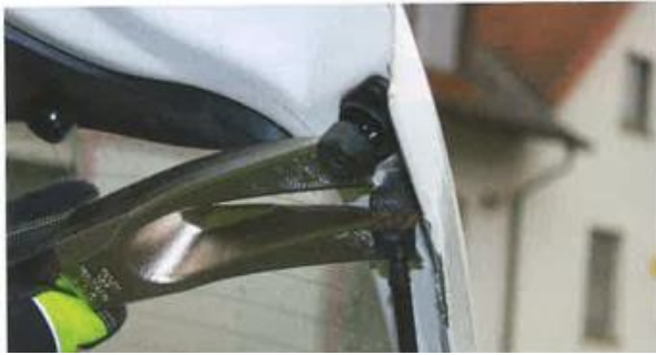
Kofferraum: Entfernung der Gasdruckdämpfer der Heckscheibe