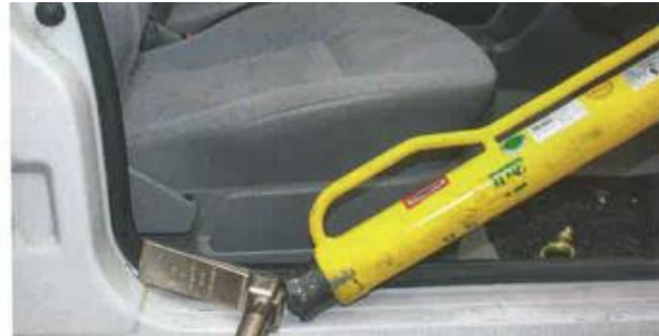
Stütze: Das Tool eignet sich nach dem Einschlagen des Dorns als Widerlager z.B. für Rettungszyylinder