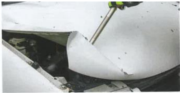
Schnelle Öffnung: Einsatz des Tools an der Motorhaube