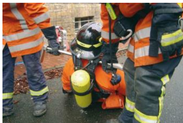
Crashrettung: bei Atemschutzunfällen Tool als Tragegriff nutzen