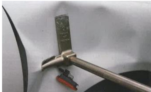
Clever: Schaffung eines Spalts an der A-Säule über den Blinker